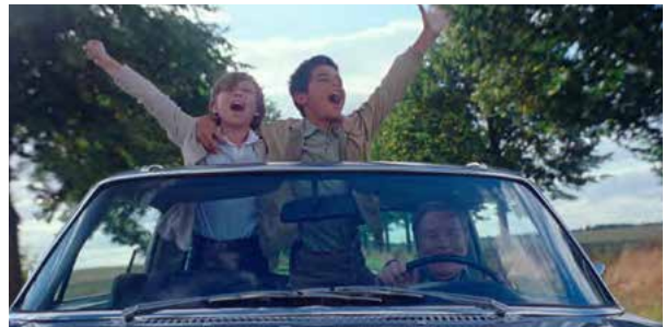
~ Ende der 1970er-Jahre