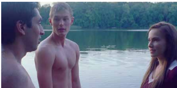
~ Ende der 1980er-Jahre