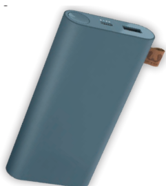
Fresh`n Rebel Powerbank