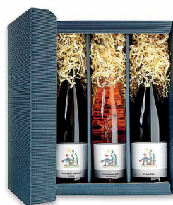
Weinset der Lebenshilfe