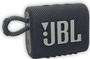
Bluetooth-Box von JBL

... denn für jedes neu geworbene GEW-Mitglied erwartet Dich eine unserer Prämien.